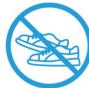
ÉVITER LES EFFORTS PHYSIQUES