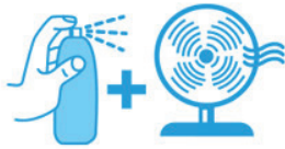
MOUILLER SON CORPS ET SE VENTILER