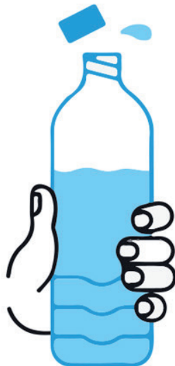
BOIRE RÉGULIÈREMENT DE L'EAU