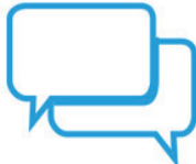
DONNER ET PRENDRE DES NOUVELLES DE SES PROCHES