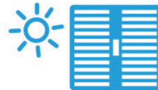
MAINTENIR SA MAISON AU FRAIS : FERMER LES VOLETS LE JOUR