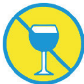
NE PAS BOIRE D'ALCOOL