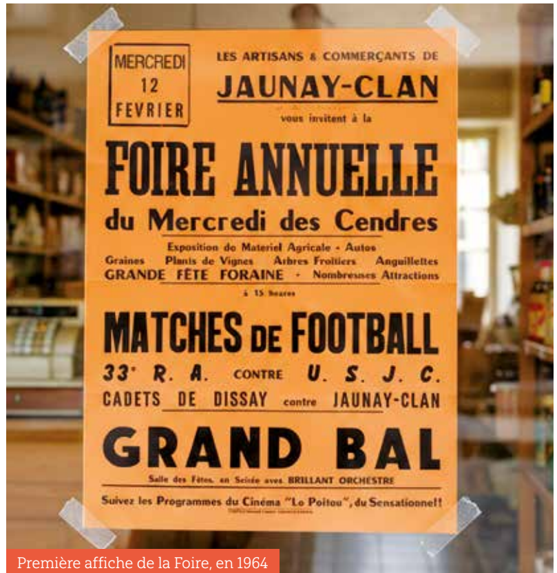
Première affiche de la Foire, en 1964

En 1988, la foire était programmée pour la 1 ère fois, le 3 ème week-end de mars, elle se tenait jusque là le dernier week-end de février. Mais les viticulteurs trouvaient cette date trop précoce pour présenter un vin de qualité. Cette année marque aussi la dernière édition sur le champ de foire, elle se tiendra en 1989 à l'Agora avant de prendre possession dès 1990 du complexe sportif. L'événement prenant de plus en plus d'ampleur, il était nécessaire de trouver un site plus approprié. Depuis, seule la pandémie du Covid (annulation de l'édition 2020 et organisation d'un drive en 2021) est venue perturber cet événement phare de la commune.