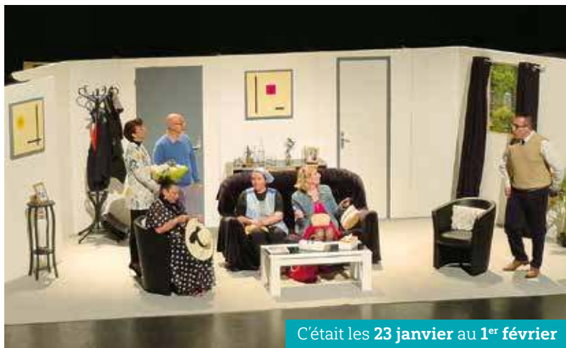
C'était les 23 janvier au 1 er février