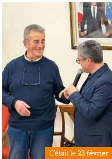
C'était le 23 février