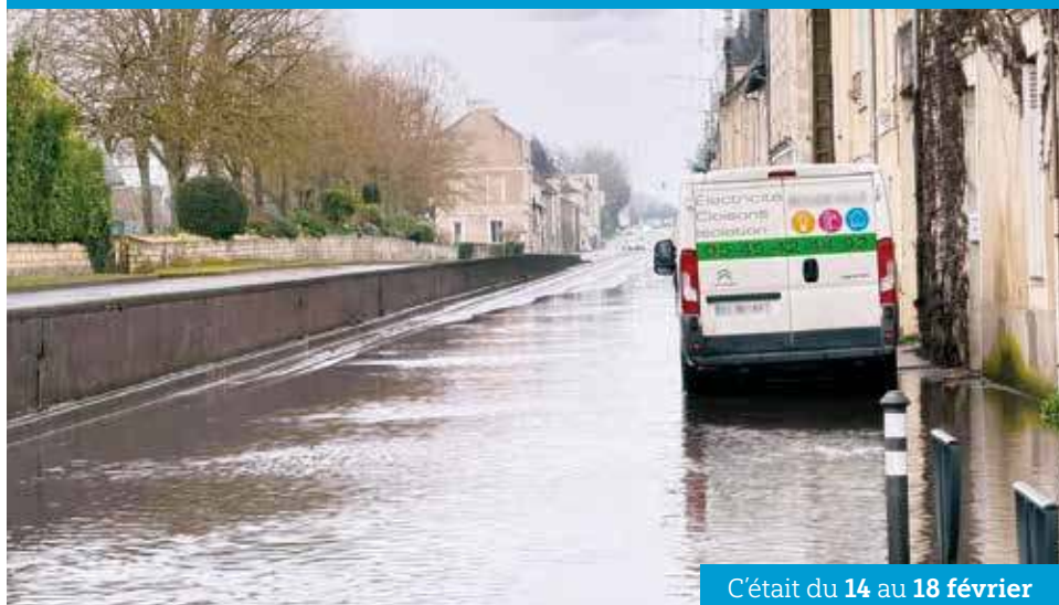
C'était du 14 au 18 février

Le mois de février a été marqué par une pluviométrie exceptionnelle, ce qui a engendré une montée des eaux du Clain nécessitant la fermeture partielle de la RD910, un phénomène qui n'était pas arrivé depuis plusieurs années. Si le plan communal de sauvegarde n'a pas été déclenché, une cellule de crise a néanmoins été réunie en Mairie. Aucune habitation n'a été évacuée mais une surveillance renforcée et des actions préventives menées en porte-à-porte ont été mises en place.