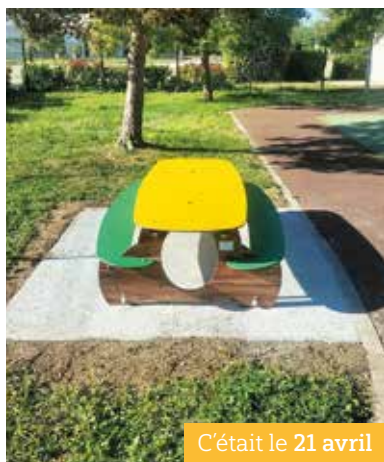
C'était le 21 avril

▲ L'aire de jeux située à proximité du city stade s'est vu dotée d'une table de pique-nique à hauteur d'enfant. Un mobilier adapté, à l'ombre d'un arbre, pour un pique-nique, un goûter, ou des activités calmes. Ce mobilier supplémentaire vient compléter la rénovation des installations dont la structure pour les plus petits avait été remplacée en 2025.