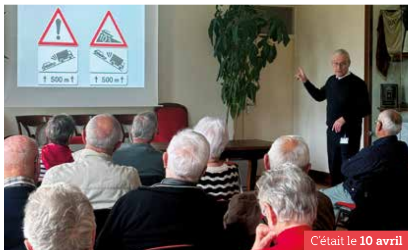
C'était le 10 avril